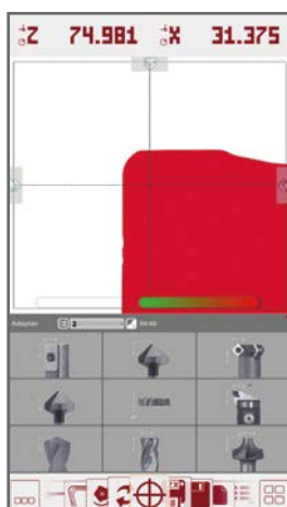
Rychlé a jednoduché měření standardních nástrojů díky funkci EZstart